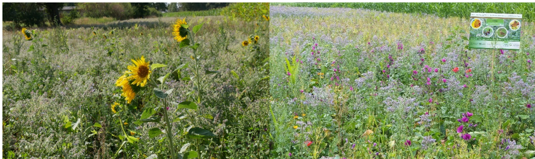
Aufnahmen vom Blühstreifen zeigen die Vielfalt der Pflanzen